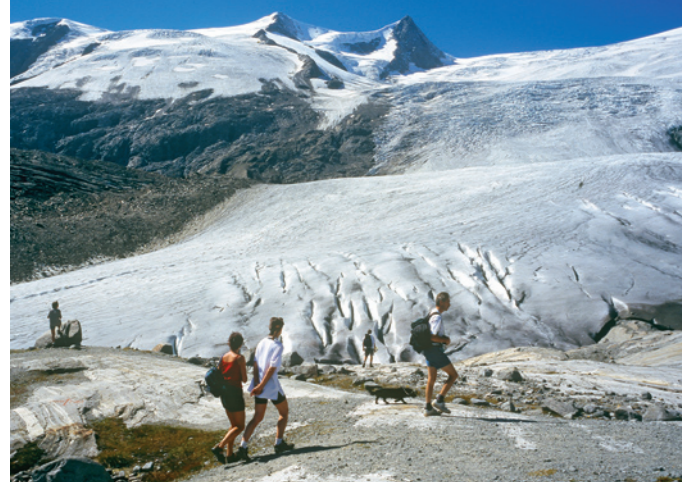
Gletscherlehweg Innerschölb, Nationalpark Hohe Tauern

Zufahrt: von Matrei i. O. auf der Felbertauernstraße bis zum Materai Tauernhaus (Nationalpark-Wanderbus) Geheitz: Tagestour Berghaus Außergschölb 1.700 m, neue Prager Hütte 2.796 m, Venedigerhaus Innerschölb 1.700 m